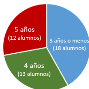
Figura 1. Duración de los estudios de los alumnos que defendieron su tesis hasta el curso 2017-18.

establecidos por el Real Decreto 99/2011, pero, en opinión de la Comisión académica también sería necesario reflexionar sobre si el actual marco normativo no es demasiado estricto en cuanto a los requisitos temporales en el caso de las tesis realizadas en el ámbito de las Ciencias de la Salud, lo que podría tener efectos negativos en su calidad y en la producción científica de los programas.