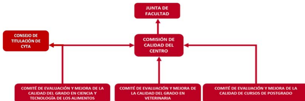
Figura 1.1. ESTRUCTURA DEL SGIC DE LA FACULTAD DE VETERINARIA

El SGIC de la Facultad de Veterinaria (Figura 1.1.) se estratifica en una estructura piramidal que tiene como base los Comités de Evaluación y Mejora de la Calidad de cada una de las titulaciones que se imparten en la Facultad y que son coordinados por la Comisión de Garantía de Calidad de la Facultad (CC-FV). La supervisión final recae sobre la Junta de Facultad. En el caso del Grado en CYTA, el Consejo de Titulación de CYTA (CT-CYTA) regula las actividades de las actividades del Comité de Evaluación y Mejora de la Calidad específico (CEMC-CYTA).